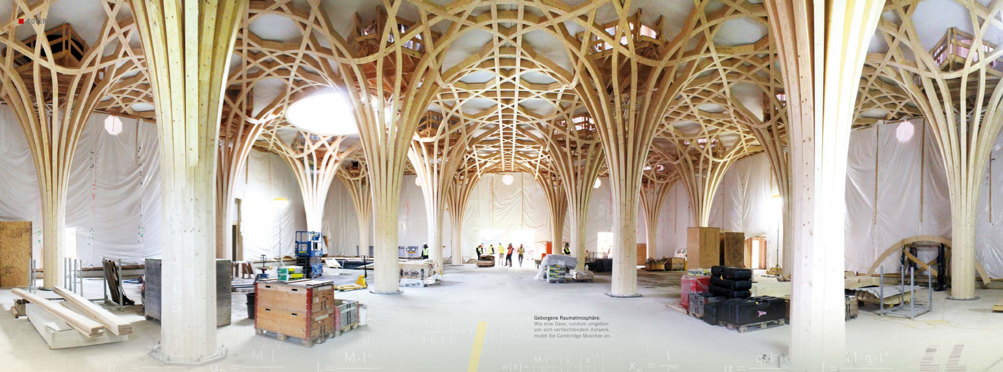
Geborgene Raumatmosphäre: Wie eine Oase, rundum umgeben von sich verflechtendem Astwerk, mutet die Cambridge Moschee an.

WEGEN DER KUNDENPRÄFERENZ, DER UMSETZBARKEIT UND AUS KOSTENGRÜNDEN WURDE AUF DIE HOLZBAUWEISE UMGESCHWENKT.