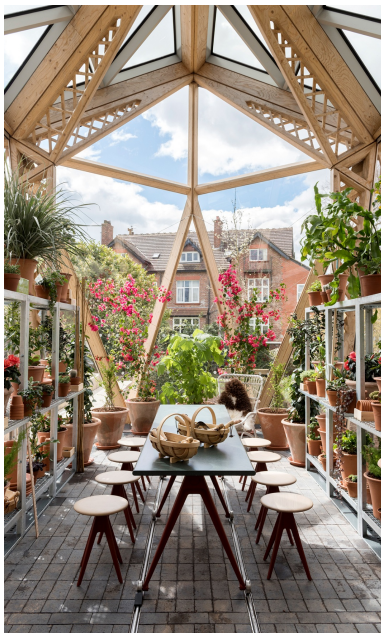
Lichtdurchflutete Atmosphäre im Innenraum