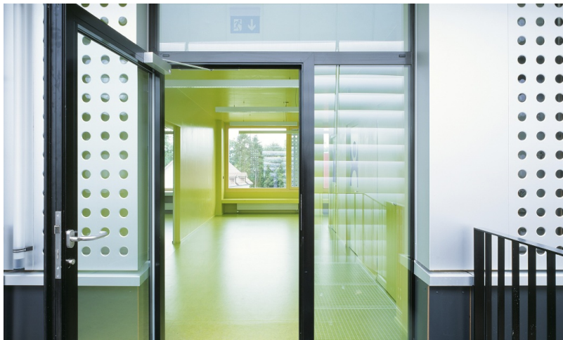
Grosszügiger Eingangsbereich im provisorischen Schulhaus