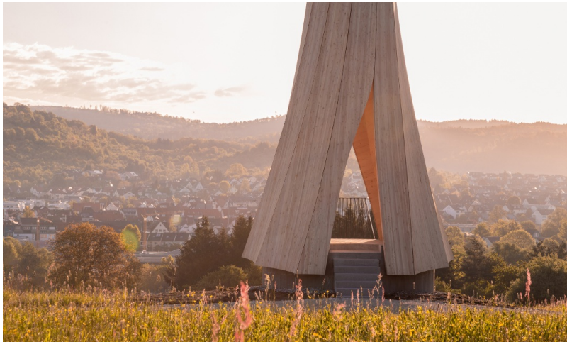
14.2 Meter hoher Turm aus Fichten-CLT