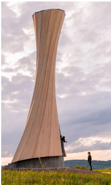
Eine Lärchenfassade umhüllt den Turm